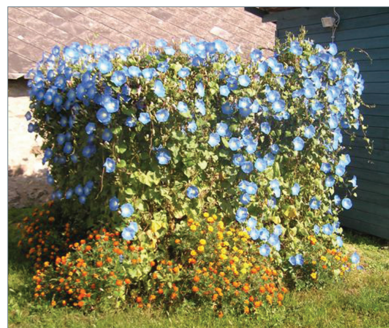
Virággal beültetett komposztsiló